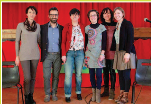
Foto della presentazione dell'Associazione con parte dei genitori fondatori